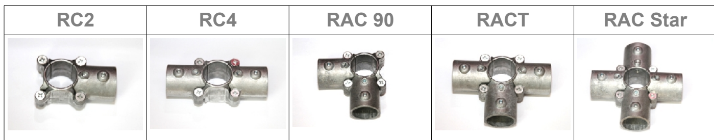
Photographies non contractuelles